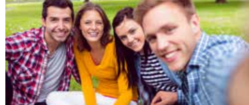
Investeer voldoende in Club 18! p.3