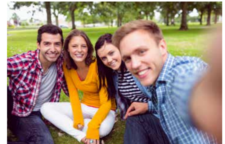
▲ De stad moet voldoende investeren in de nieuwe jeugdllokalen van Club 18.

Net voor de vakantie werd het budget voor het nieuwe lokaal van Club 9, het jeugdhuis in Koersel, nog aanzienlijk verhoogd. N-VA Beringen begrijpt dat niet dezelfde investering gemaakt kan worden voor Club 18, maar blijft bij het stadsbestuur aandringen om toch ook de belangrijke kosten van zowel thermische als akoestische isolatie te dragen, zodat Club 18 een goede nieuwe start kan nemen.