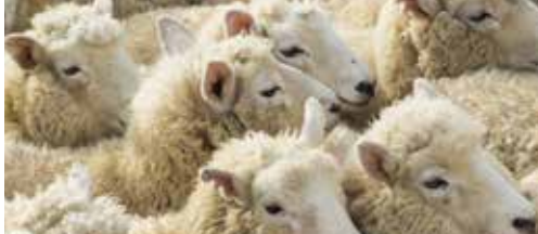
Kostprijs Offerfeest hoger dan verwacht p.2