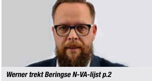
Werner trekt Beringse N-VA-lijst p.2