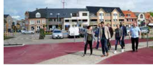
Het Dorpsplein kan weer leven p.3